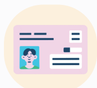
マイナンバー カード