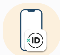
デジタルIDアプリ xID(クロスアイディ)