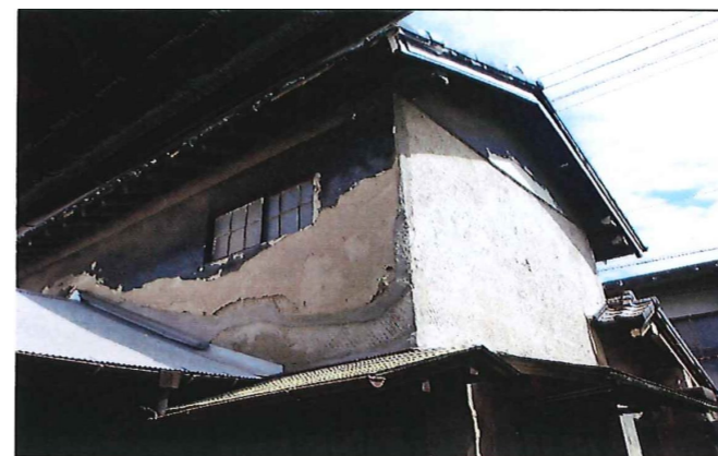
漆喰が剥落した工事前の状況