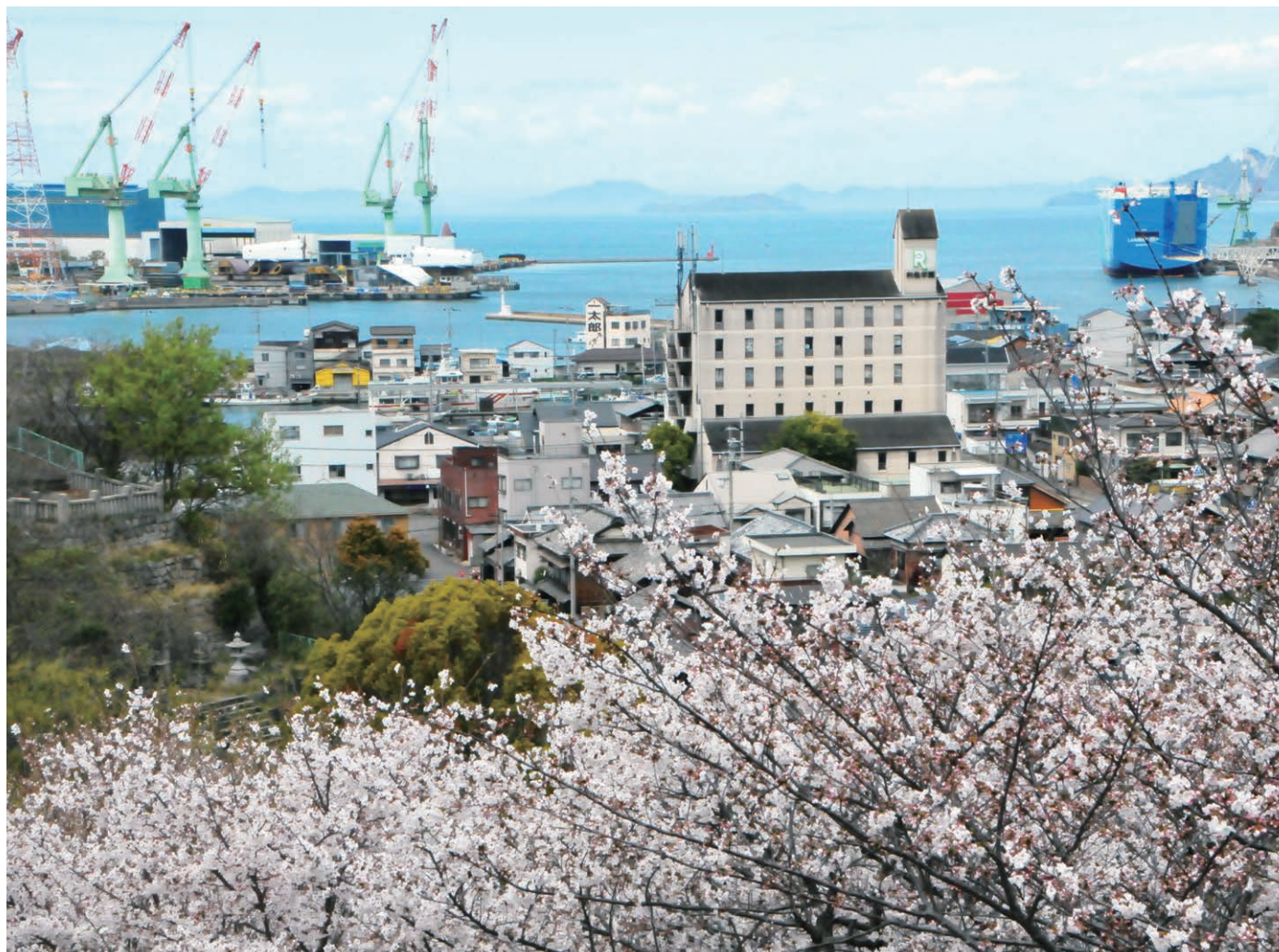
多度津港と桜の競演